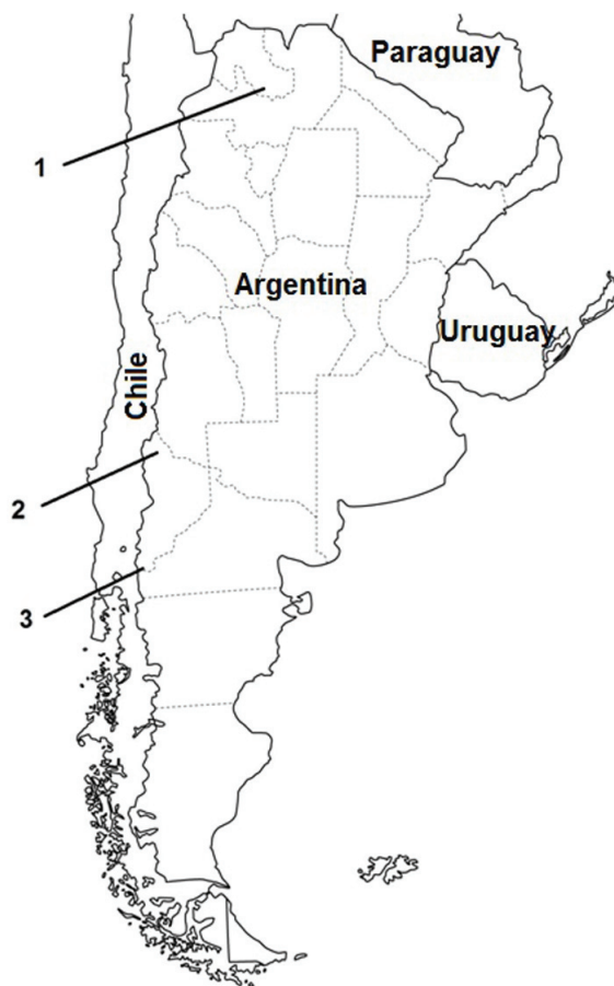
FIG. 2. Áreas de captura y anillado de ejemplares machos de Pato de los Torrentes ( Merganetta armata ) para su posterior fotoidentificación y seguimiento durante períodos de entre 2 y 4 años. M. a. leucogenis capturados en la provincia de Jujuy, en el noroeste argentino (1) y M. a. armata capturados en el Parque Nacional Nahuel Huapi y en el Parque Provincial El Tromen, el noroeste de la Patagonia argentina (2 y 3).

tes sin entrenamiento previo en la observación de aves (11). A cada uno de ellos se le pidió indicar si las fotografías de ambas columnas en cada ficha pertenecían al mismo ejemplar.