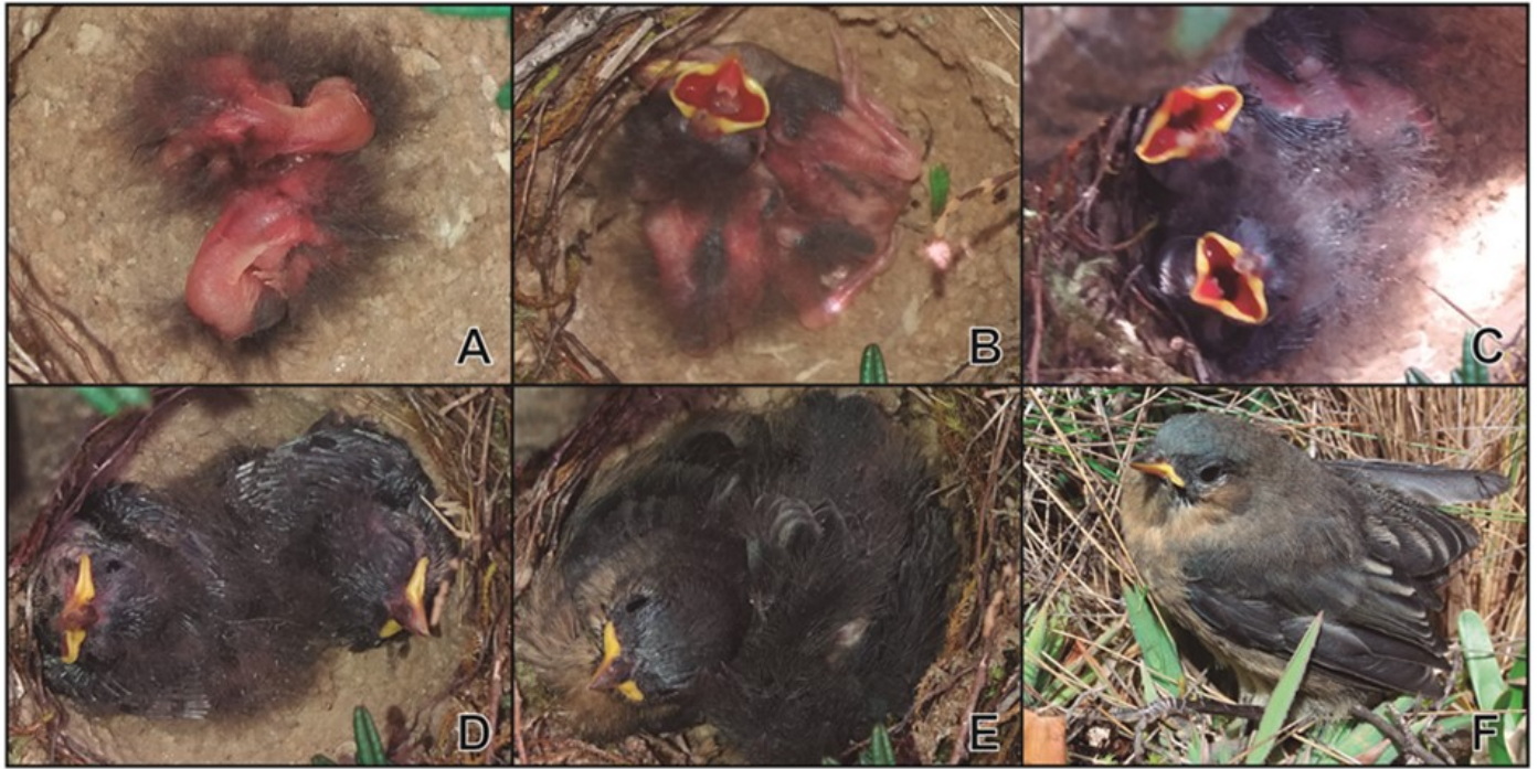
Figura 2. Desarrollo de los pichones de Dacnis Andino Norteño ( Xenodacnis petersi ) en nidos observado en la Provincia de Azuay, Ecuador. (A) día 1. (B) día 4. (C) día 8. (D) día 10. (E) día 15. (F) Pichón al salir del nido (volantón).

concuerdan con lo registrado para D. sittoides , D. lafresnayii y Pinzón Sabanero Azafranado ( Sicalis flaveola ) (Palmerio 2012, Soria & Barboza 2016, Molina & Ordóñez in prep.), así como la alimentación del macho a la hembra de S. flaveola al momento de empollar (Palmerio 2012).