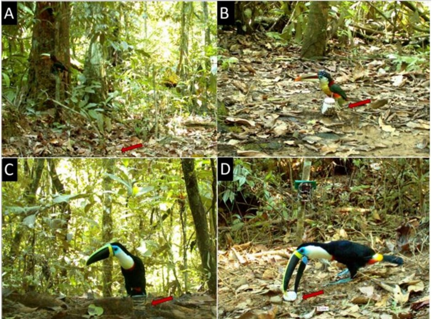
Figura 1. Fotografías de interacciones de las cuatro especies de tucanes con los perfumes en el Parque Nacional ANMI Madidi. Las flechas apuntan a los frascos perforados con algodón impregnado con Chanel N° 5 o Calvin Klein Obsession for Men. A) Interacciones a media distancia (< 3 m), Arasari Pico Marfil ( Pteroglossus azara ); B) Interacciones cercanas (< 30 cm), Arasari Encrespado ( Pteroglossus beauharnaesii ); C) Interacciones cercanas (< 30 cm), Tucán Pico Acanalado ( Ramphastos vitellinus ); D) Contacto directo (picoteo, manipulación del frasco con el pico), Tucán Garganta Blanca ( Ramphastos tucanus ).

las aves. Antiguamente se creía que las aves eran anósmicas, destacando más sus habilidades visuales y acústicas que su capacidad olfativa (Roper 1999, Caro et al. 2015, Corfield et al. 2015). Actualmente el interés por el olfato en las aves ha aumentado en gran medida, varios estudios revelan que las aves utilizan el olfato en diversos contextos, como la búsqueda de alimentos, la orientación y la reproducción (Holbrook 2003, Amo et al. 2012, Corfield et al. 2015). En base a los resultados que se obtuvieron en este trabajo, es posible que los tucanes tengan un olfato bastante desarrollado. Es posible que los tucanes en el momento de la búsqueda de frutos maduros, confundan ese olor típico de los frutos con el olor de los perfumes, provocando la atracción. Es probable que el ingrediente que actúa como atrayente sea la civetona, un compuesto sintético derivado del almizcle de un mamífero (la civeta, Viverra civetta ; Wawrzyniak et al. 2005), pero los tucanes también podrían verse atraídos por la presencia de alcoholes, los cuales podrían indicar frutas fermentadas en la naturaleza. Aún no se tiene información específica de estudios del olfato en la familia Ramphastidae. Esto debería ser estudiado con mayor detalle en laboratorios y realizando experimentos controlados.